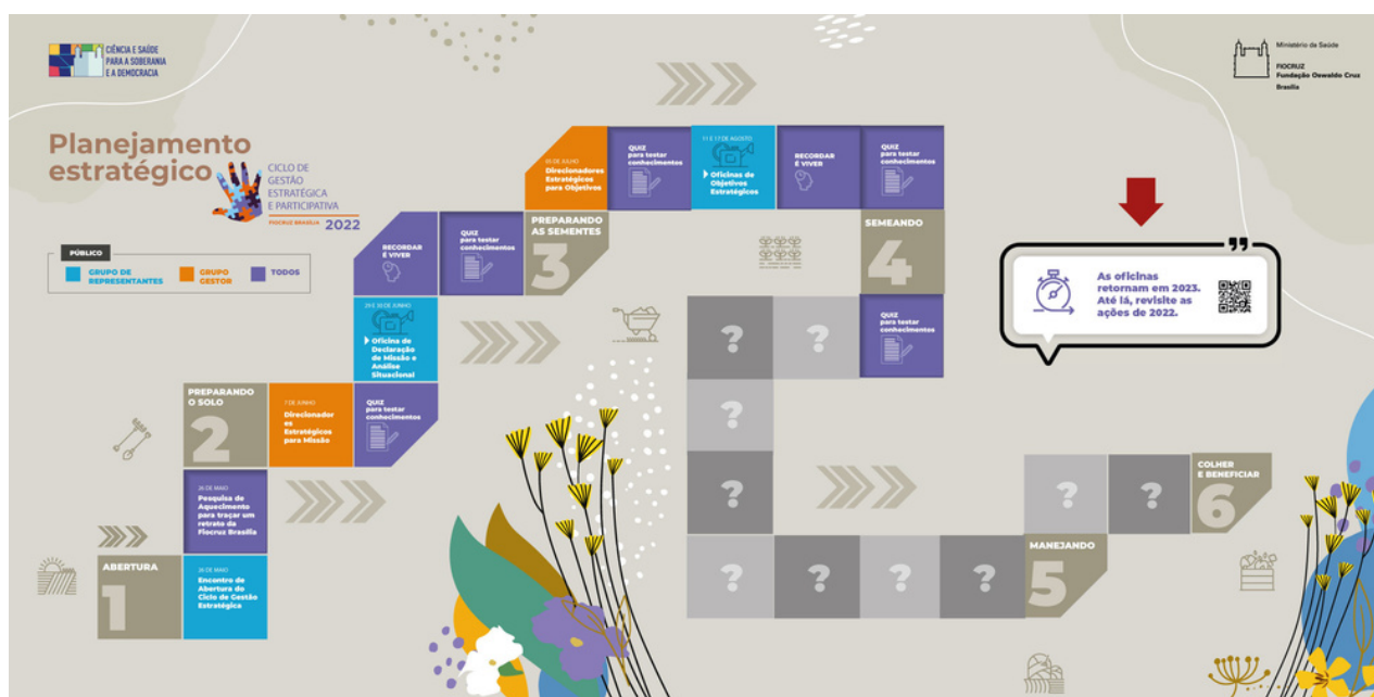
Painel com as atividades do Ciclo